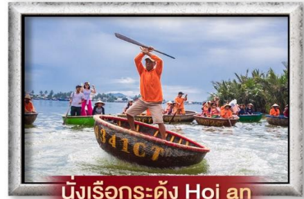
นั่งเรือกระดิง Hoi an