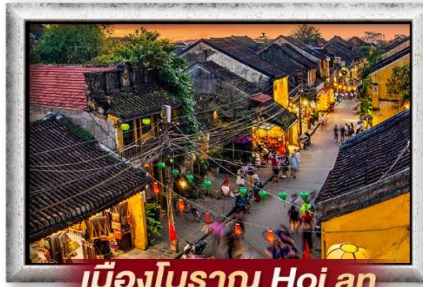
เมืองโบราณ Hoi an