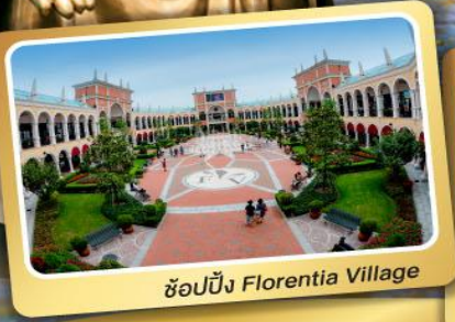
ช้อปปิ้ง Florentia Village