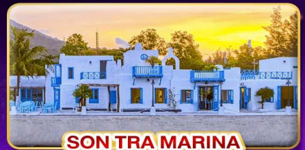
SON TRA MARINA