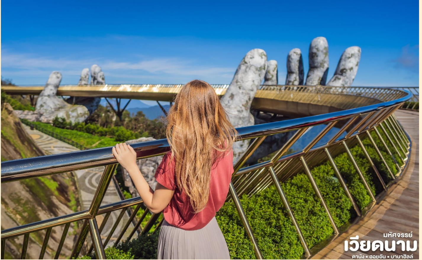
มหัศจรรย์ เวียดนาม คาบัง • ฮอยอัน • บานาฮิลล์

นำท่านชม สะพานสีทอง สถานที่ ท่องเที่ยวใหม่ล่าสุดตั้งโดดเด่น เป็นเอกลักษณ์อย่างสวยงาม บน เขาบานาฮิลล์ นำท่านสู่จุดที่สร้าง ความตื่นตะลึงให้นักท่องเที่ยว มองดูอย่างอึ้งการที่ซึ่งเต็มไปด้วย ด้วยเสน่ห์แห่งตำนานและ จินตนาการของการผจญภัยที่ สวนสนุก The Fantasy Park (รวมค่าเครื่องเล่นบนสวนสนุก ยกเว้น หุ่นซีผึ้ง โรงบ่มไวน์ และ รถไฟเหาะ Alpine Coaster ที่ไม่รวมให้ในรายการ) ที่เป็นส่วน