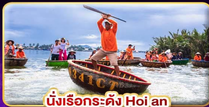
นั่งเรือกระดิง Hoi an