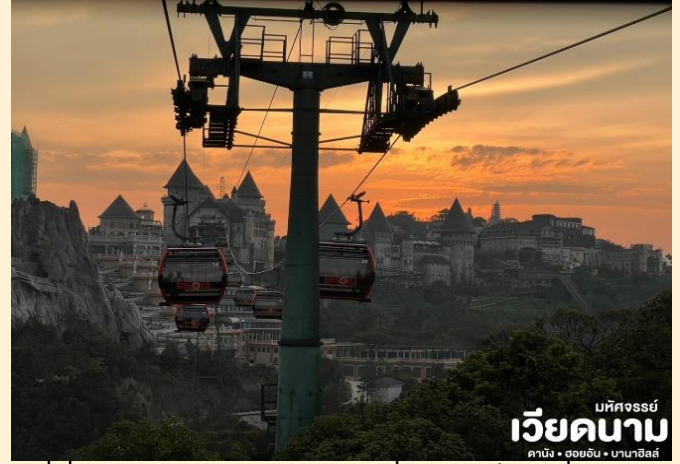
มทศจรรย เวียดนาม ดานัง • ฮอยอัน • บานาฮิลล์

นั่งกระเช้าขึ้นสู่บานาฮิลล์ กระเช้าแห่งบานาฮิลล์นี้ได้รับการบันทึกสถิติโลกโดย World Record ว่าเป็นกระเช้าไฟฟ้าที่ยาวที่สุด ประเภท Non Stop โดยไม่หยุดแะมีความยาวทั้งสิ้น 5,042 เมตร และเป็นกระเช้าที่สูงที่สุด 1,294 เมตร นักท่องเที่ยวจะได้สัมผัสปุยมะหมอกและบางจุดมีเมฆลอยต่ำกว่ากระเช้าพร้อมอากาศบริสุทธิ์อันสดชื่นจนทำให้ท่านอาจลืมไปเสียด้วยซ้ำว่าที่นี่ไม่ใช่ยุโรปเพราะอากาศที่หนาวเย็นเฉลี่ยตลอดทั้งปีประมาณ 10 องศาเท่านั้น