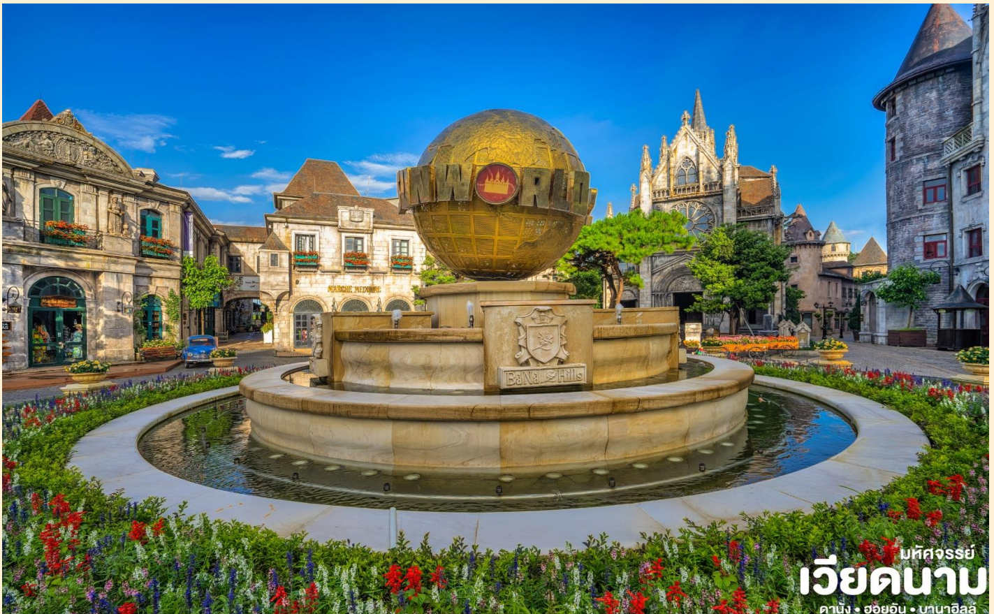
มทศจรรย เวียดนาม ดานัง • ฮอยอัน • บานาฮิลล์