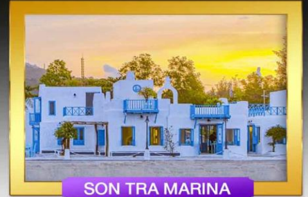
SON TRA MARINA