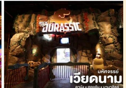
มหัศจรรย์ เวียดนาม คาบัง • ฮอยอัน • บานาฮิลล์

หนึ่งของบานาฮิลล์ท่านจะ ได้พบกับเครื่องเล่นในหลายรูปแบบเช่นทำทนายความมันส์ของหนัง 4D,