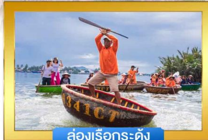
ล่องเรือกระด้ง