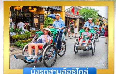
นั่งรถสามล้อซีโคล์