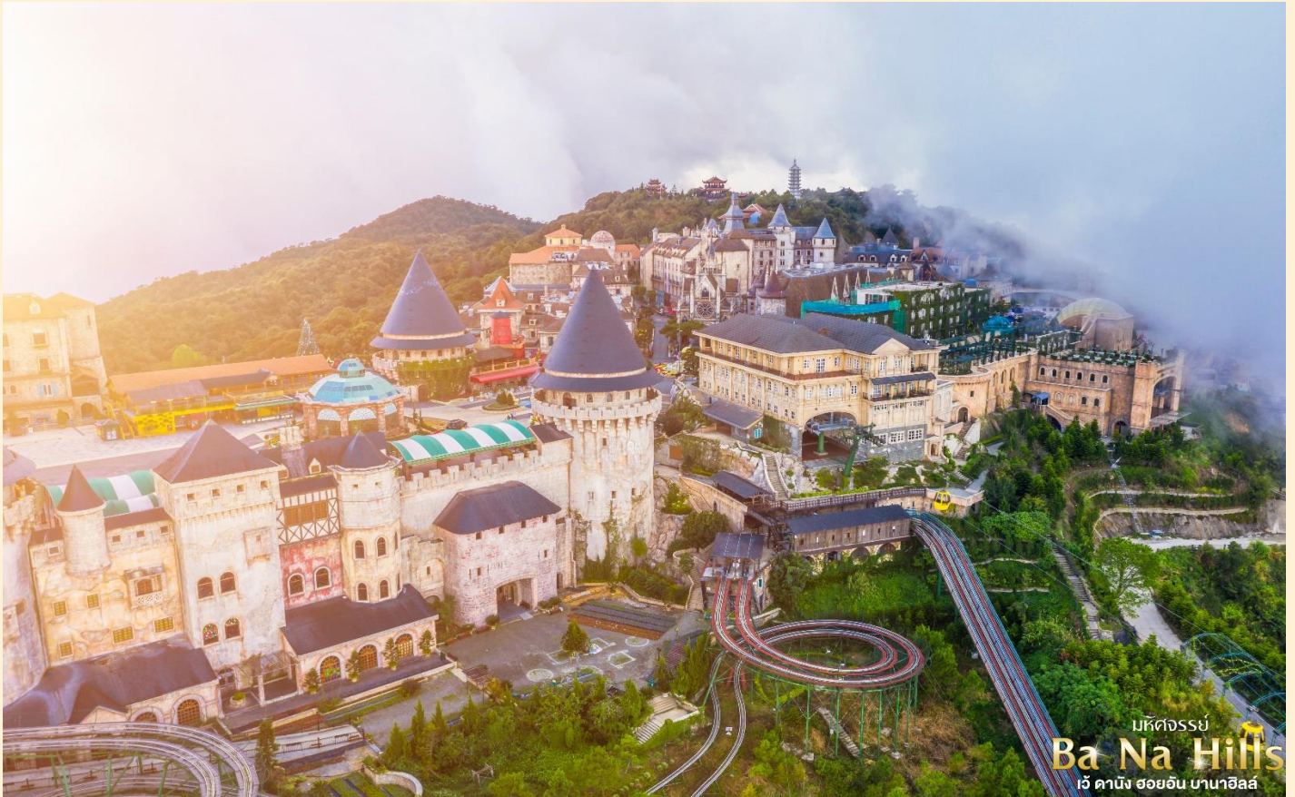
มิถิดจรรย Ba Na Hills เว้ ดานัง ฮอยอัน บานาฮิลล์