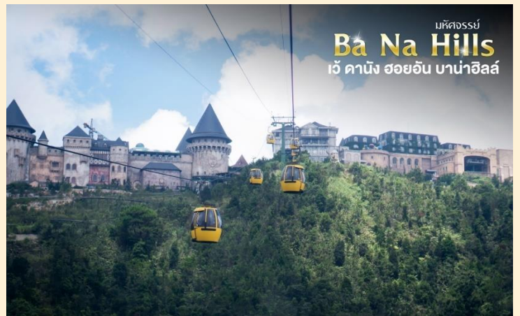
มิถิดจรรย Ba Na Hills เว้ ดานัง ฮอยอัน บานาฮิลล์

กระเช้าแห่งบานาฮิลล์นี้ได้รับการบันทึกสถิติโลกโดยWorld Record ว่าเป็นกระเช้าไฟฟ้าที่ยาวที่สุดประเภท Non Stop โดยไม่หยุดแะมีความยาวทั้งสิ้น 5,042 เมตรและเป็นกระเช้าที่สูงที่สุดที่ 1,294 เมตรนักท่องเที่ยวจะได้สัมผัสสขุยเมฆหมอกและบางจุดมี