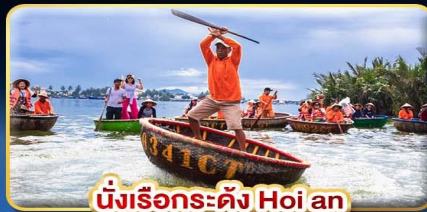
นั่งเรือกระด้ง Hoi an