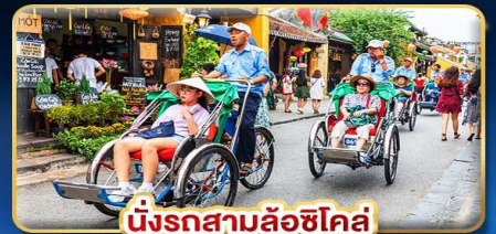
นั่งรถสามล้อซิคอล์