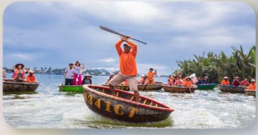
นั่งเรือกระด้ง Hoi an