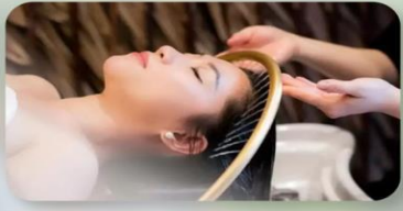
สระพมสไคล์เวียดนาม