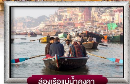
ล่องเรือแม่น้ำคงคา