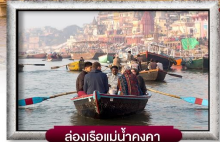
ล่องเรือแม่น้ำคงคา