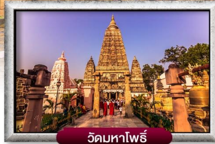
วัดมหาโพธิ์