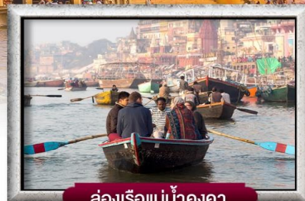
ล่องเรือแม่น้ำคงคา