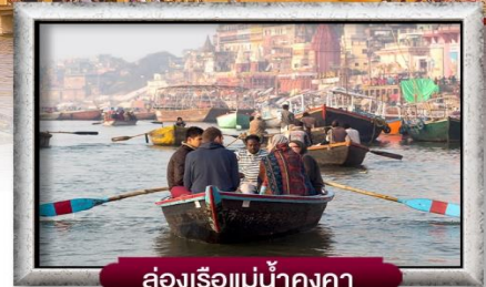
ล่องเรือแม่น้ำคงคา