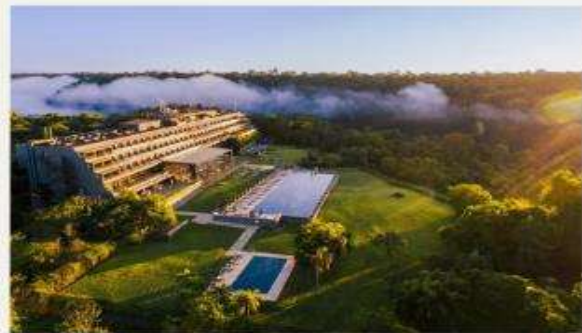
Gran Meliá Iguazú Argentina Side