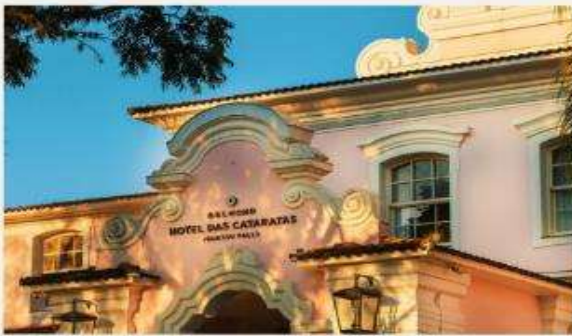
Hotel das Cataratas, A Belmond Hotel

โรงแรมที่พักระดับ 5 ดาว สองแห่ง...ริมน้ำตกอิ瓜ซุ