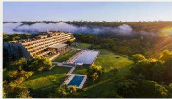
Gran Meliá Iguazú Argentina Side