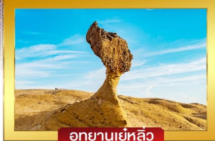
อุทยานเขี่ยหลิว