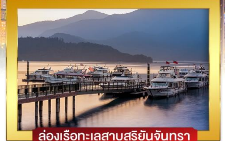
ส่องเรือทะเลสาบสุริยจันทร์