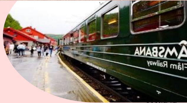
ชมรมชาติ

นำท่าน นั่งรถไฟสายโรแมนติก “ฟลัมสบานา” จาก เมืองฟลัม สู่ เมืองไมร์ดัล (Flamsbana Railway from Flam to Myrdal) เส้นทางรถไฟที่โด่งดังที่สุดของประเทศนอร์เวย์ นักท่องเที่ยวจะได้ลัดเลาะไปตาม หุบเขาที่สวยงามของประเทศนอร์เวย์ โดยรถไฟจะวิ่งผ่านอุโมงค์จำนวน 20 แห่ง โดยมีอุโมงค์ 18 แห่งได้ใช้แรงงานคนขุด ซึ่งระหว่างทางท่านจะได้ชื่นชมกับทัศนียภาพอันงดงามที่สรรสร้างแสนน่าประทับใจของหุบเขาอันสูงชัน และธารน้ำแข็งกลาเซียร์ แห่งฟยอร์ด ไปจนถึงเมืองไมร์ดัล (Myrdal) ในระหว่างทางที่นั่งรถไฟ นักท่องเที่ยวจะได้หยุดชมความสวยงามของ น้ำตกจอสฟอสเซน (Kjosfossen) อีกหนึ่งจุดท่องเที่ยวที่มีความสวยงามและได้รับความนิยมจากนักท่องเที่ยวเป็นอย่างมาก น้ำตกมีความสูงประมาณ 225 เมตร ส่วนน้ำในน้ำตกนั้นไหลมาจากทะเลสาบบนเทือกเขาชื่อทะเลสาบเรนนาร์กาวัทเน็ต (Reinungavatnet) และทะเลสาบเซลเทฟัทเน็ต (Seltuftvatnet) หลังจากนั้นขึ้นรถไฟชมวิวต่อไปตลอดเส้นทางจน กระทั่งถึงเมืองไมร์ดัลซึ่งเป็นสถานีสุดท้ายของการนั่งรถไฟสายโรแมนติกนั่นเอง