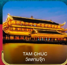
TAM CHUC วัดตามจุก