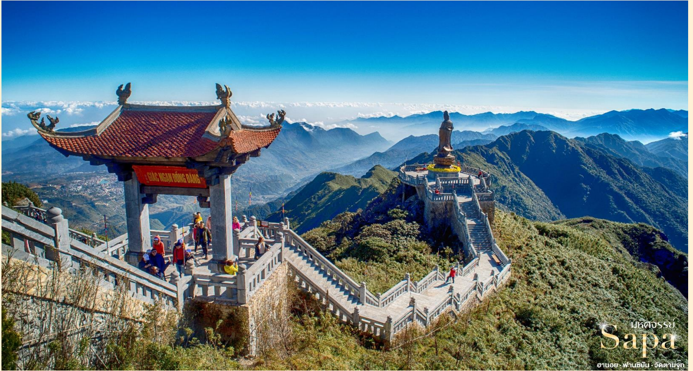
มรดกธรณี Sapa ฮานอย · ฟานซิปัน · วัดคำปู้จุก

นับว่าเป็นยอดเขาที่สูงที่สุดในแถบอินโดจีน สูงถึง 3,143 เมตร ชมทิวทัศน์เมืองซาปาในมุมมองแบบพาโนรามา