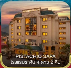
PISTACHIO SAPA โรงแรมระดับ 4 ดาว 2 คืน