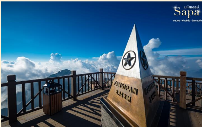
มรดกธรณี Sapa ฮานอย · ฟานซิปัน · วัดคำปู้จุก