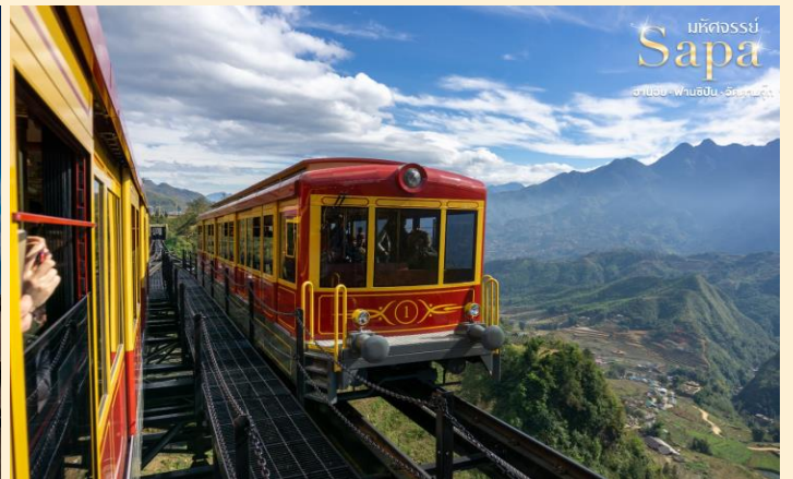
มรดกธรณี Sapa ฮานอย · ฟานซิปัน · วัดคำปู้จุก

จากนั้น นำท่าน นั่งรถรางใหม่ สุดจากสถานีซาปาสู่สถานีกระเช้าเพื่อขึ้น ยอดเขาฟานซิปัน ระยะทางประมาณ 2 กิโลเมตร ท่านจะได้สัมผัสกับความสวยงามของธรรมชาติระหว่างสองข้าง ทาง นำท่านขึ้นสู่ฟานซิปันยอดเขาสูงสุดแห่งเวียดนามและในภูมิภาคอินโดจีน สูง 3,143 เมตร จนได้รับการกล่าวขานว่า “หลังคาแห่งอินโดจีน” สูงที่สุดในอินโดจีนบนความสูงจากระดับน้ำทะเล