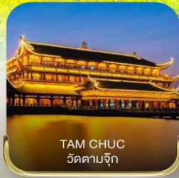
TAM CHUC วัดตามจุก