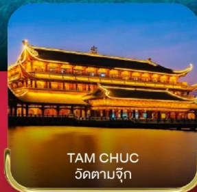
TAM CHUC วัดตามจุก