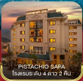
PISTACHIO SAPA โรงแรมระดับ 4 ดาว 2 คืน