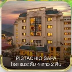
PISTACHIO SAPA โรงแรมระดับ 4 ดาว 2 คืน