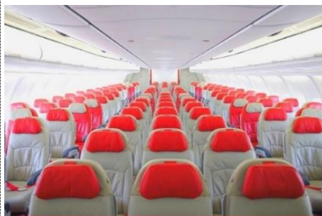
เครื่องลำใหญ่ 377 ที่นั่ง