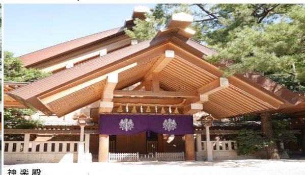
~ 5 ~