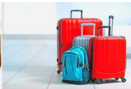
น้ำหนักกระเป๋า สูงสุด 20 กก.