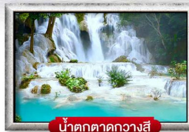
น้ำตกตาดขวางสี