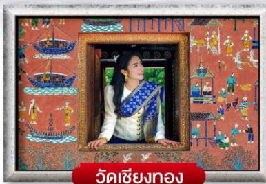
วัดเชียงทอง