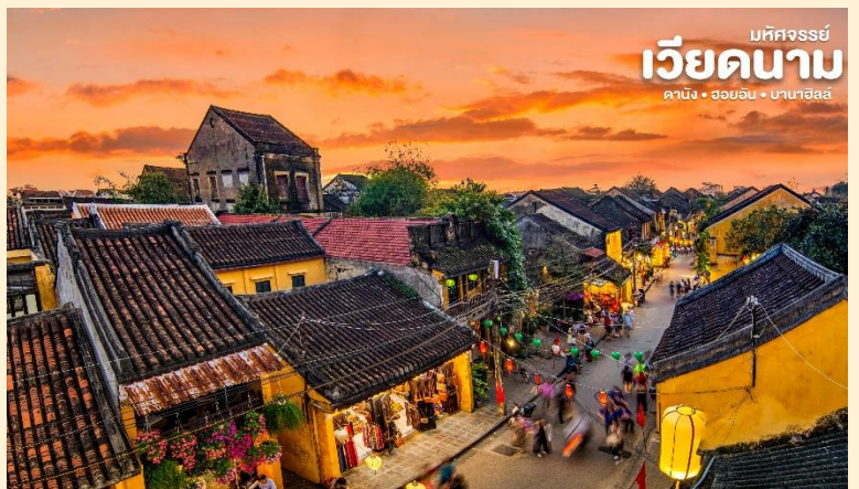
มหัศจรรย์ เวียดนาม ดานัง • ฮอยอัน • บานาฮิลล์

อันใช้เป็นที่พักของคนหลายรุ่น วัดนี้มีจุดเด่นอยู่ที่งานไม้แกะสลักกลดลลายสวยงามท่าน สามารถ