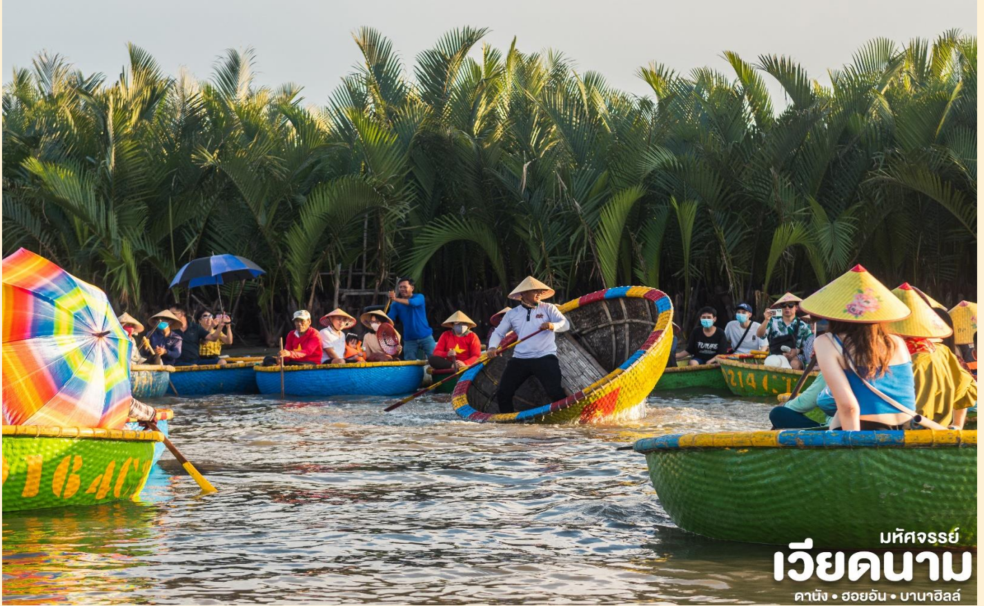
มหัศจรรย์ เวียดนาม ดานัง • ฮอยอัน • บานาฮิลล์