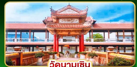
วัดนามเซิน