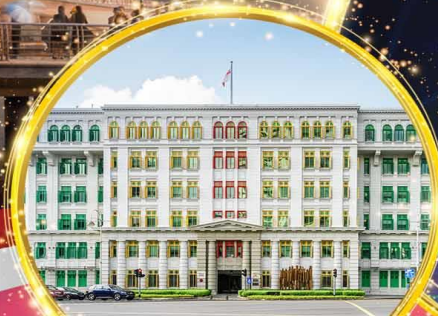
Old Hill Street Police Station