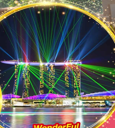
Wonderful Light & Water Spectacular