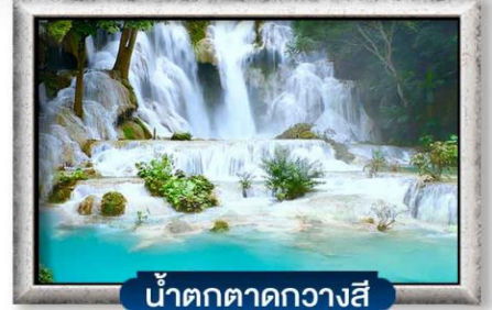
น้ำตกตาดกวางสี