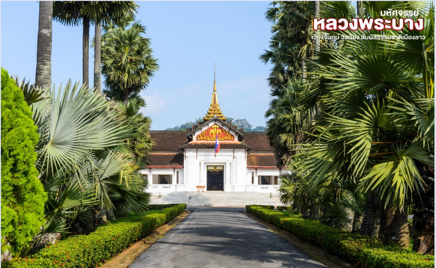
บหัทศรรย หลวงพระบาง เวียงจันทน์ วิทยาเขต สิบสมรรถยชาติเมืองลาว

พิพิธภัณฑ์ ประกอบด้วยหอพิพิธภัณฑ์ห้องรับแขกของเจ้ามหาชีวิตและพระมเหสี ห้องท้องพระโรง ทางด้านหลังก็เป็นพระตำหนักซึ่งมีเครื่องใช้ไม้สอยต่างๆ จัดเก็บไว้เป็นระเบียบเรียบร้อย