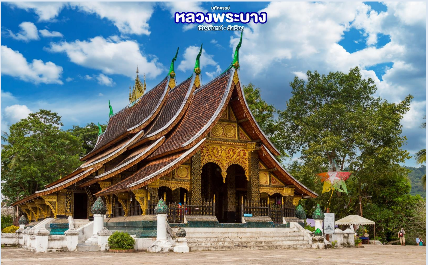
มณฑลจรรย หลวงพระบาง เวียงจันทน์ • อังเวียง

จากนั้น นำท่านเดินทางสู่สถานีรถไฟความเร็วสูง เตรียมตัวมุ่งหน้าสู่เวียง (ใช้เวลาเดินทางประมาณ 1 ชั่วโมง) ให้ท่านได้ชมบรรยากาศ ธรรมชาติตลอดสองข้างทางในรถไฟ