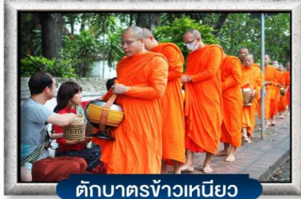
ตักบาตรข้าวเหนียว