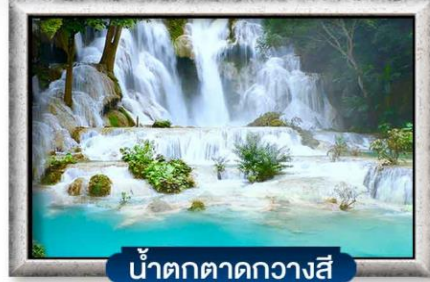
น้ำตกตาดกวางสี