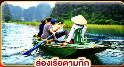
ล่องเรือตามก๊ก