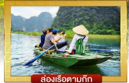
ล่องเรือตามก๊ิก