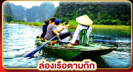
ล่องเรือตามก๊ก