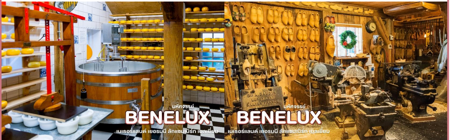
บทคัดย่อ BENELUX BENELUX เนเธอร์แลนด์ เยอรมนี ลักเซมเบิร์ก เบลเยียม เนเธอร์แลนด์ เยอรมนี ลักเซมเบิร์ก เบลเยียม

จากนั้นนำท่านสู่ หมู่บ้านกังหันลมซานสคันส์ (Zaanse Schans) (ใช้เวลาประมาณ 40 นาที) หมู่บ้านที่มีการอนุรักษ์กังหันลมและบ้านเรือนดั้งเดิมของฮอลแลนด์ซึ่งปัจจุบันเปิดเป็นพิพิธภัณฑ์ เปิดให้เข้าชมวิถีชีวิตความเป็นอยู่ของชาวดัชต์ที่ใช้กังหันลมกว่าร้อยละ ๙๐ ในงานอุตสาหกรรมมาตั้งแต่ศตวรรษที่ 17-18 โดยทำหน้าที่ผลิตน้ำมันจากดอกมัสตาร์ดกระดาชงานไม้