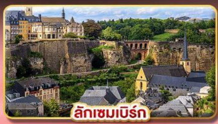
ลักเซมเบิร์ก