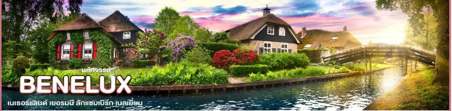
บทคัดย่อ BENELUX เนเธอร์แลนด์ เยอรมนี ลักเซมเบิร์ก เบลเยียม

เลาะคลองที่มีความยาวประมาณ 7.5 กิโลเมตร อิสระให้ท่านเที่ยวชมหมู่บ้านแห่งนี้ พร้อมเก็บภาพความประทับใจกับบรรยากาศของหมู่บ้าน unseen แห่งเนเธอร์แลนด์