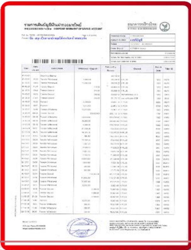
ตัวอย่าง Bank Statement ที่ผู้สมัครต้องยื่นธนาคาร

3.4 ปรับสมุดบัญชีธนาคารตัวจริง และเตรียมไปในวันที่ยื่นวีซ่า