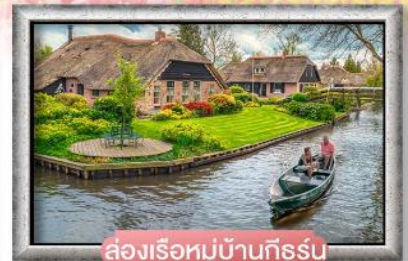
ส่องเรือหมู่บ้านทีร์รูิน