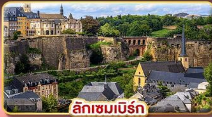
ลักเซมเบิร์ก