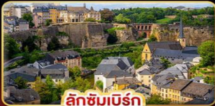
ลักซิมเบิร์ก