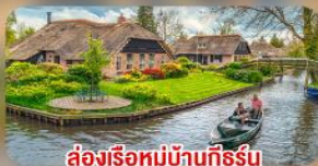
ล่องเรือหมู่บ้านทึร์น