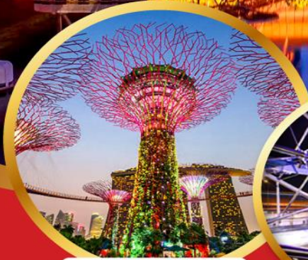
การ์เด้นส์ บาย เดอะ เบย์