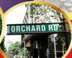
ถนนช้อปปิ้งออร์ชาร์ด