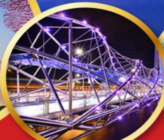
สะพานเกลียวเฮลิคซ์