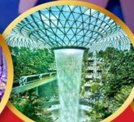
สนามบินชางจี