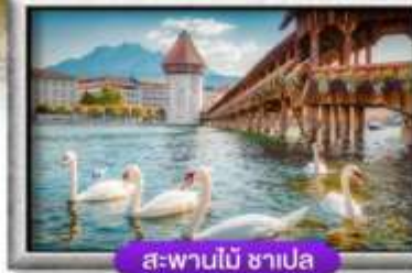
ส-พานไม้ ซาเปลา