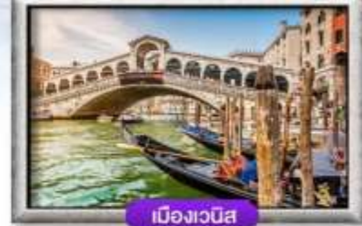
เมืองเวนิส

พิเศษ! หอยยอสภาโก้ + ไวน์แดงฝรั่งเศส | ชีสฟองดูสวิตเซอร์แลนด์ ส่น่าเก้ดดีเสีนหนักแบบเวนิส