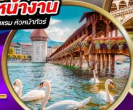
สะพานไม้ ชาเปล