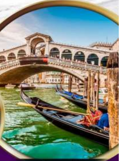
เมืองเวนิส