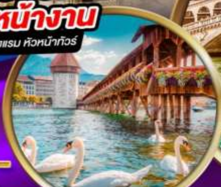
สะพานไม้ ชาเปล