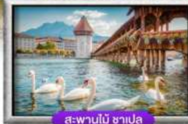
ส-พานไม้ ซาเปลา