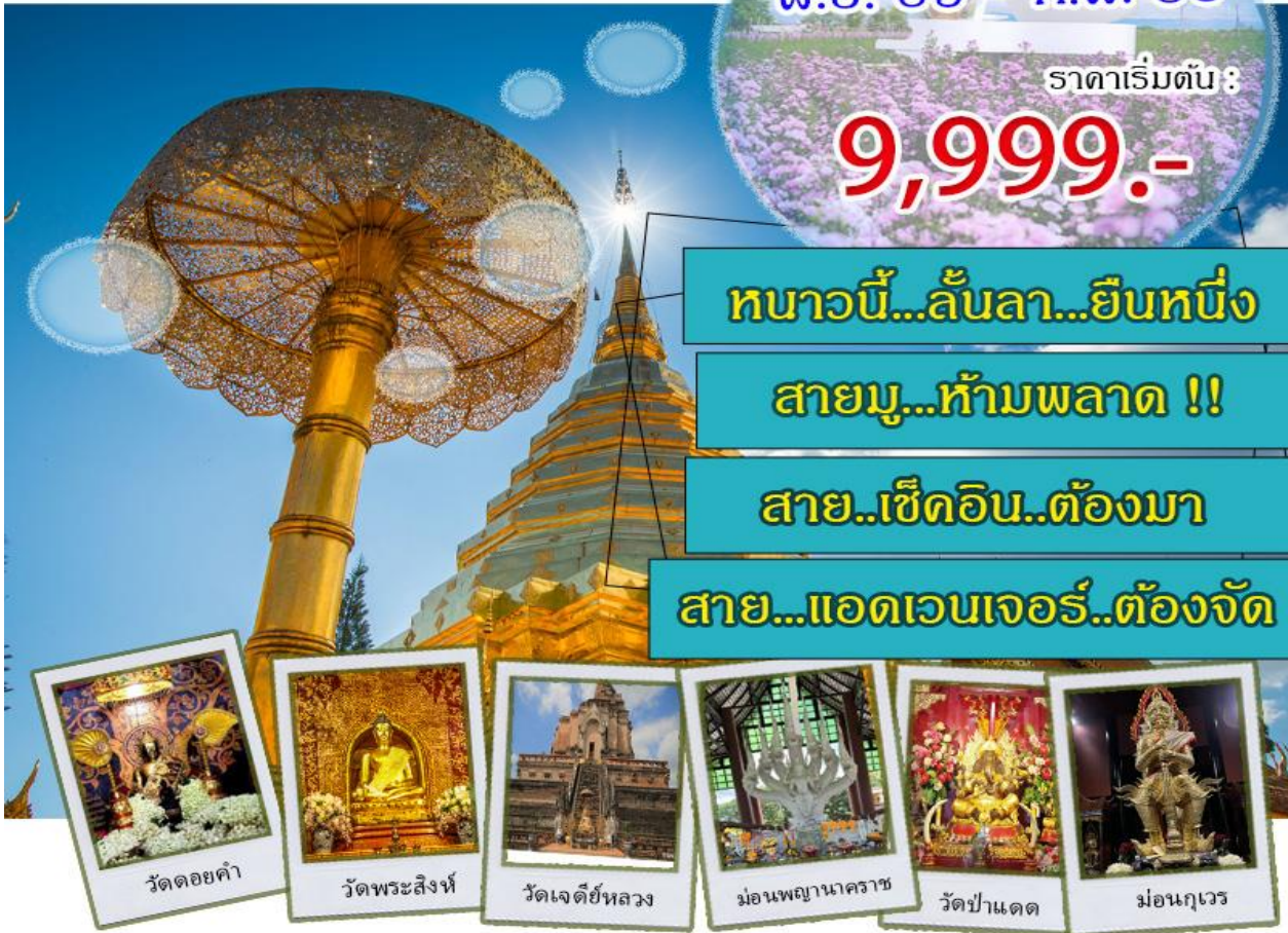
วัดดอยคำ