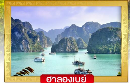
ฮาลองเบย์