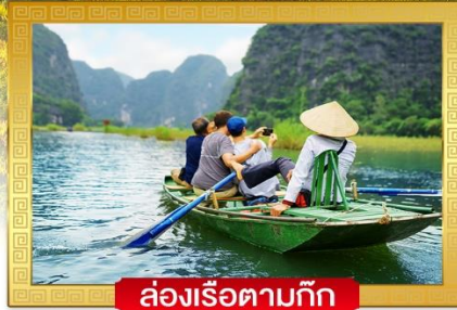
ล่องเรือตามก๊ก