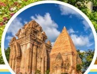
ปราสาทพนมค