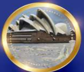
WINTER มิถุนายน-สิงหาคม 8 °C - 18 °C