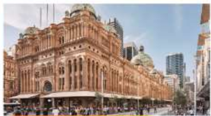
ควีนวิกตอเรียบิลдинг