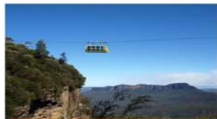
หุบเขาสีน้ำเงิน