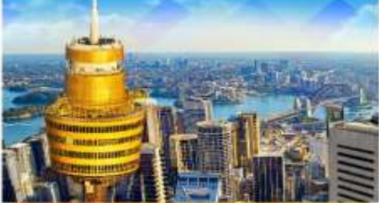
ซิดนีย์ทาวเวอร์+มูฟฟี่ซิดนีย์ทาวเวอร์