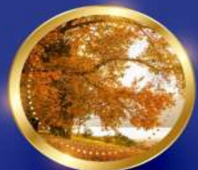
AUTUMN มีนาคม-พฤษภาคม 11 °C - 25 °C