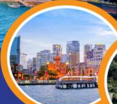
ย่านเดอะ ร็อคส์