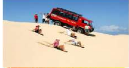
นั่งรถ4WDทะเลลุยเป็นทราย