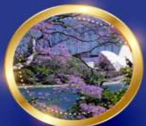
SPRING กันยายน-พฤศจิกายน 11 °C - 24 °C