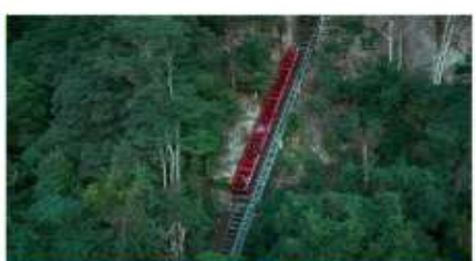
นั่งรรางที่ชันที่สุดในโลก