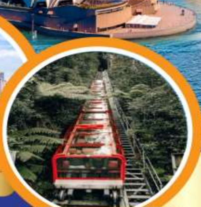
นั่งรถรางที่ชันที่สุดในโลก