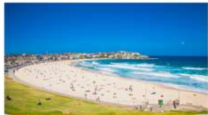
หาดมอนีต