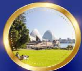
SUMMER ธันวาคม-กุมภาพันธ์ 17 °C - 26 °C