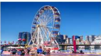
ตารี่สิงฮาร์เบอร์