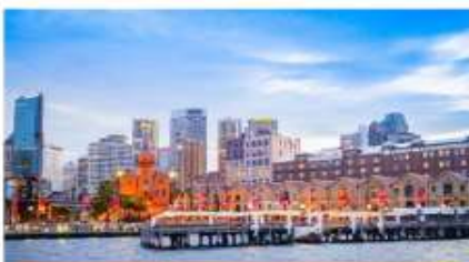
ย่านเดอะริคส์