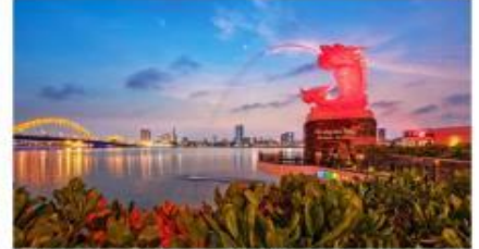
เช็คอินคาร์พดาร์ท้อน