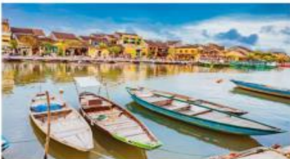
ฮอยอัน เมืองมรดกโลก