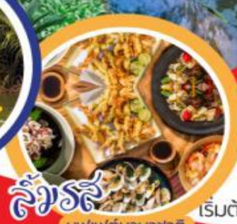
ลิ้มรส บุฟเฟ่ต์นานาชาติ