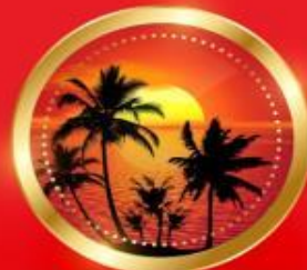
SUMMER มิถุนายน-สิงหาคม