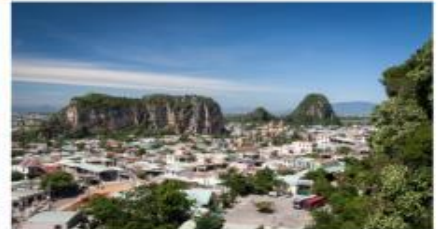
หมู่บ้านเกาะสลักหินอ่อน