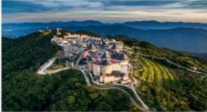
หมู่บ้านฝรั่งเศส