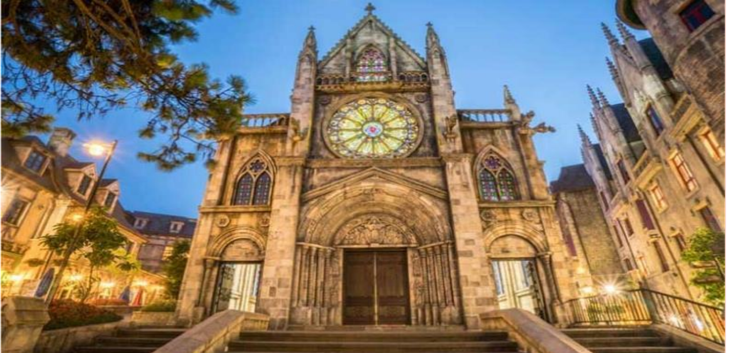
โบสถ์ Saint Denis โบสถ์คาทอลิกที่หมู่บ้านฝรั่งเศสบนบานาฮิลส์, เวียดนาม