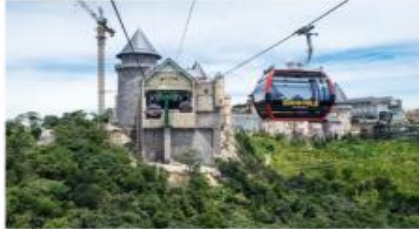
ขึ้นกระเช้าลอยฟ้า