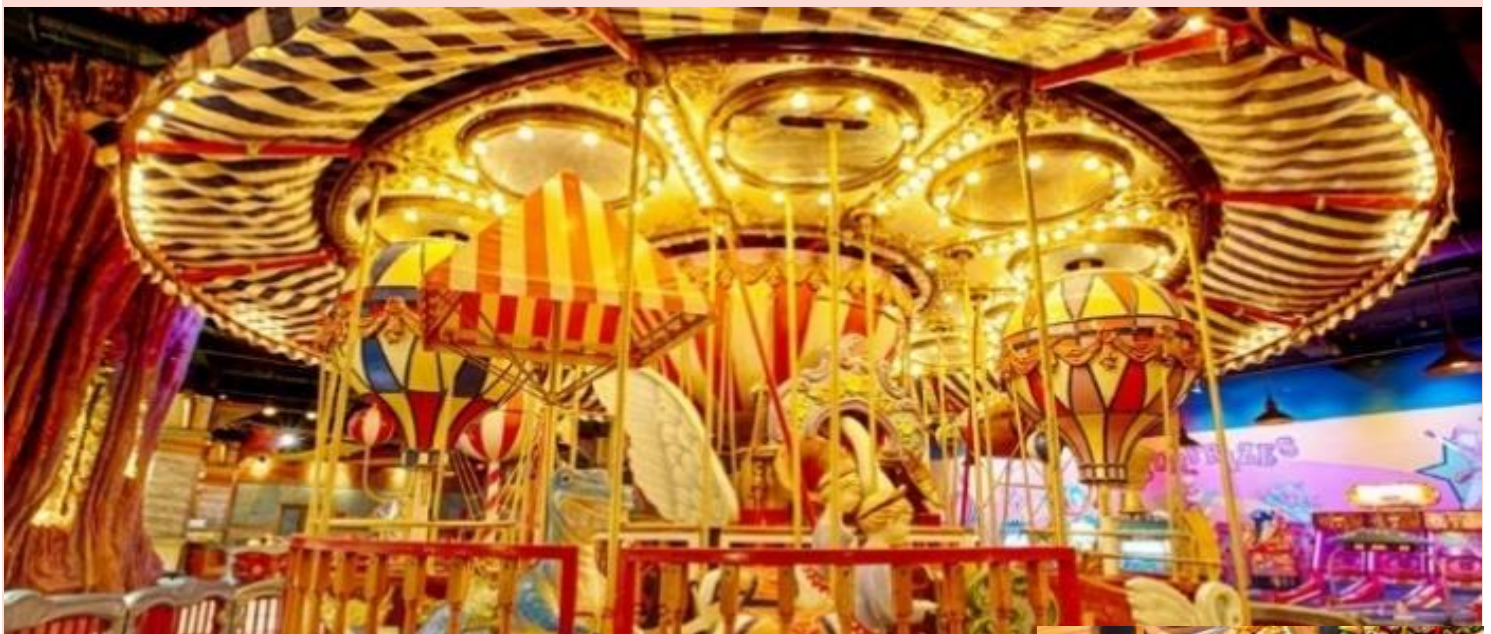
สวนสนุกแฟนตาซีพาร์ค สวนสนุกใหม่และกลางแจ้งขนาดใหญ่มีหลายโซนให้ร่วมสนุกไม่ว่าจะเป็น จูราสสิก พาร์ค (Jurassic Park) ท่องโลกล้านปี , เอาท์รัน (Outrun) สนุกสุดเหวี่ยงกับเกมขับรถ