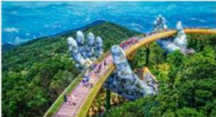
สะพานลอยฟ้า Golden Bridge