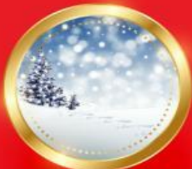
WINTER ธันวาคม-กุมภาพันธ์