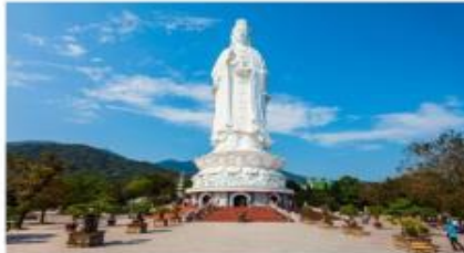
วัดหลินอึ้ง