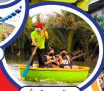
นั่งเรือกระดิง