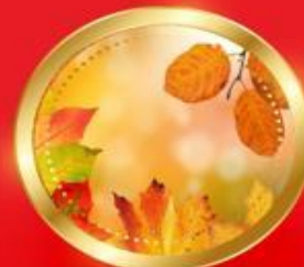
AUTUMN กันยายน-พฤศจิกายน