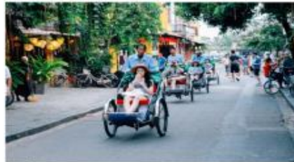
นั่งสามล้อชมเมืองฮอยอัน