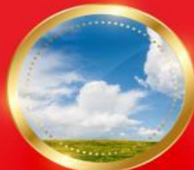
SPRING มีนาคม-พฤษภาคม