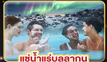
แช่น้ำแร่สุขภาพ