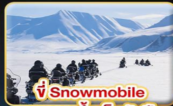
ขี่ Snowmobile บนธารน้ำแข็งพันปี