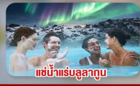
แช่น้ำแร่ลูลา गुณ