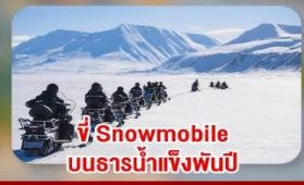
ขี่ Snowmobile บนธารน้ำแข็งพันปี