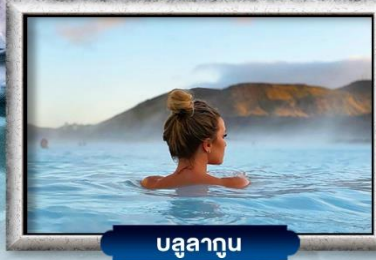
บลูลากูน