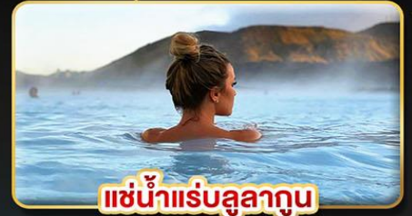
แช่น้ำแร่สุขภาพ