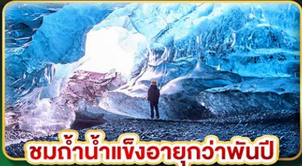
ชมก้อนน้ำแข็งอายุกว่าพันปี