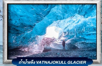
ถ้ำน้ำแข็ง VATNAJOKULL GLACIER

บินหรู สายการบิน Full Service | พิเศษ! ทานอาหารโดมกระจกิว 360 องศา