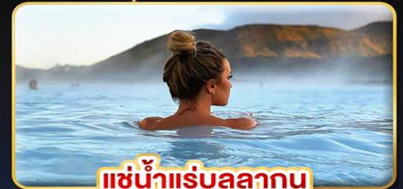
แช่น้ำแร่สุขภาพ