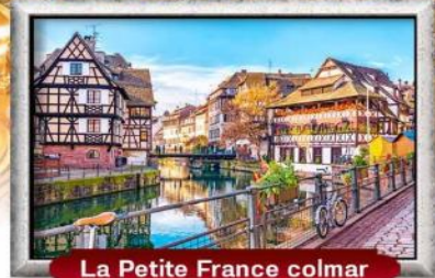
La Petite France colmar

บินทรู สายการบิน Full Service | พิเศษ! หอยแอสคาโก้