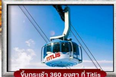
ขึ้นกระเช้า 360 องศา ที่ Titlis