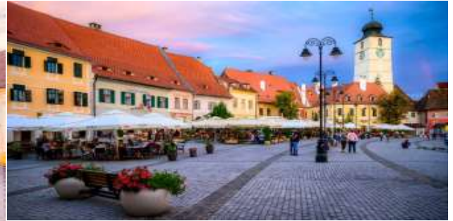
เที่ยง บริการอาหารมื้อกลางวัน ณ ภัตตาคาร

นำท่านเข้าชม “ปราสาทคอร์วิน” (Corvins Castle) หรือที่รู้จักในนาม “ปราสาทฮุนยาร์ด” (Hunyad Castle) หรือ “ปราสาทฮุนโดร์วา” (Hunedoara Castle) สร้างขึ้นในปี 1409 โดยกษัตริย์ ชาร์ลส์ที่ 1 แห่งฮังการี (Charles I