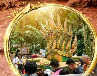
ป่าชะโนด