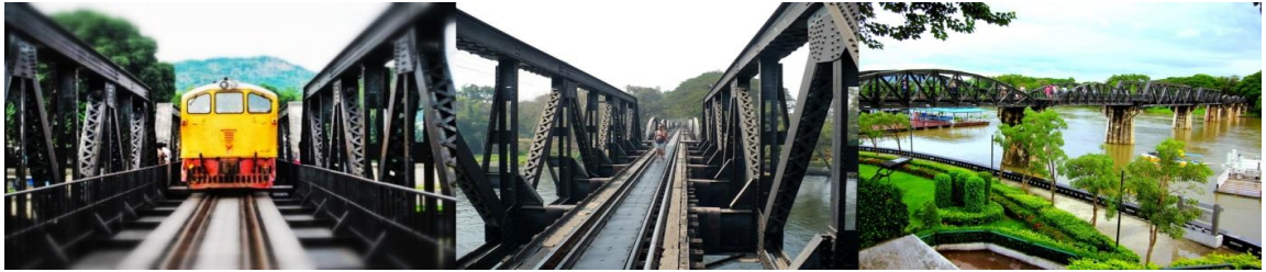
นำท่าน ล่องแพ สัมผัสธรรมชาติอันงดงามริมสองฝั่งลำน้ำแคว