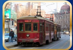
นั่งรถรางโบราณชมเมือง