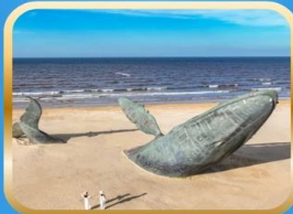
ประติมากรรมวาฬเกยตื้น