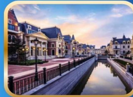
เมืองจำลองเวนิสตะวันออก