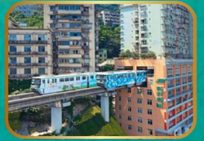
นั่งรถไฟฟ้ามหานคร