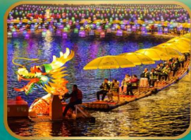
ล่องเรือมังกรแม่น้ำกิงสุ่ย