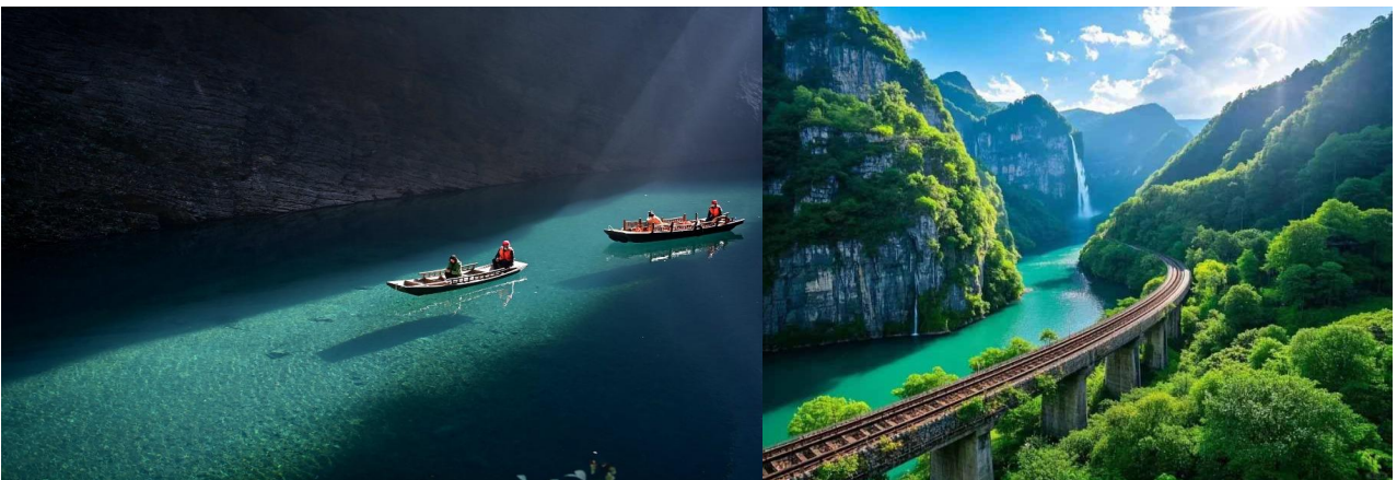
เฉินซือ - จงซิง 5วัน4คืน (SL)

นำท่านเดินทางสู่ อุทยานหุบเขาผิงซาน หรือที่เรียกกันว่า "ผิงซานแกรนด์แคนยอน" หนึ่งในสถานที่ท่องเที่ยวทางธรรมชาติที่มหัศจรรย์และกำลังได้รับความนิยมสูงสุดในประเทศจีน ได้รับฉายาว่า "เซมปอริกาแห่งเมืองจีน" และ "กระจกแห่งผิงปา" จุดขายอันดับหนึ่งคือ ผืนน้ำสีเขียวมรกตที่ใสสะอาดเย็นเย็นได้ถึงก้นแม่น้ำ เมื่อแดดส่องลงมากระทบเงาเรือไม้แจวโบราณจะทอดลงสู่ก้นหุบเขา ทำให้มองเห็นเรือเหมือนกำลัง "ลอยอยู่กลางอากาศ" ตัวหุบเขามีลักษณะเป็นหน้าผาสองชั้นสองฝั่งมีบึงเข้าหากันจนแคบมาก ในบางจุดกว้างเพียงไม่กี่เมตรและลึกหลายร้อยเมตร แสงแดดจะส่องลงมาเป็นเส้นตรงสองกระทบสายน้ำด้านล่างอย่างสวยงาม โดยจะ นั่งเรือแจวลำใหญ่ ล่องไปตามช่องเขาแคบเพื่อออกไปยังทางออกอุทยาน ใช้เวลาล่องเรือประมาณ 15-20 นาที