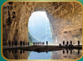
ถ้ำตึงหลง