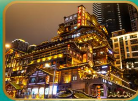
หงหย่าต้ง