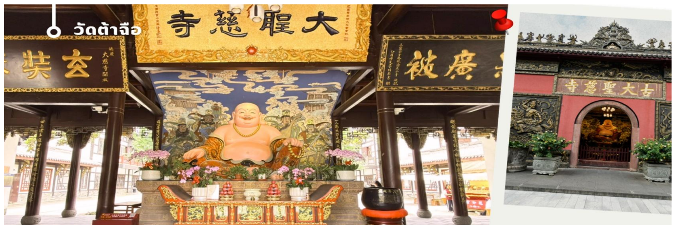
CVZTFU18 เฉิงตู ภูเขาสี่ดรุณี ป่าผิงโกว ต้ากู๋ปิงชวน 6วัน5คืน Vietjet Air (VZ) ไม่ลงร้าน (Aug'-Sep'26)

นำท่านเที่ยวชม จัตุรัสหยางเทียนวู เป็นจุดเช็คอินที่สำคัญสำหรับคนที่มาเที่ยวที่ เมืองตูเจียงเยียน บริเวณจุดต่ำๆ อำเภอตูเจียงเยียน นครเฉิงตู ไฮไลท์ของจัตุรัสหยางเทียนวู คือ ประติมากรรม แพนด้ายักษ์ ที่กำลังนอนหงายท้อง ยื่นมือถือไม้เซลฟี่สีชมพู ซึ่งออกแบบโดยนักออกแบบชื่อดัง Florentijn Hofman รูปปั้นแพนด้า ยักษ์มีความยาว 26 เมตร กว้าง 11 เมตร สูง 12 เมตร และหนัก 130 ตัน แบบท่าทางสบายๆของแพนด้าที่สร้างความประทับใจและรอยยิ้มให้กับผู้ที่มาเยือนจัตุรัสหยางเทียนวู สามารถดึงดูดนักท่องเที่ยวได้เป็นจำนวนมากเลยทีเดียว เป็นการแสดงออกด้วยภาษาทางศิลปะแบบหนึ่งทีสะท้อนชีวิตในท้องถิ่น มอบความรู้สึกสนิทสนมและมีความสุขกับผู้ชม