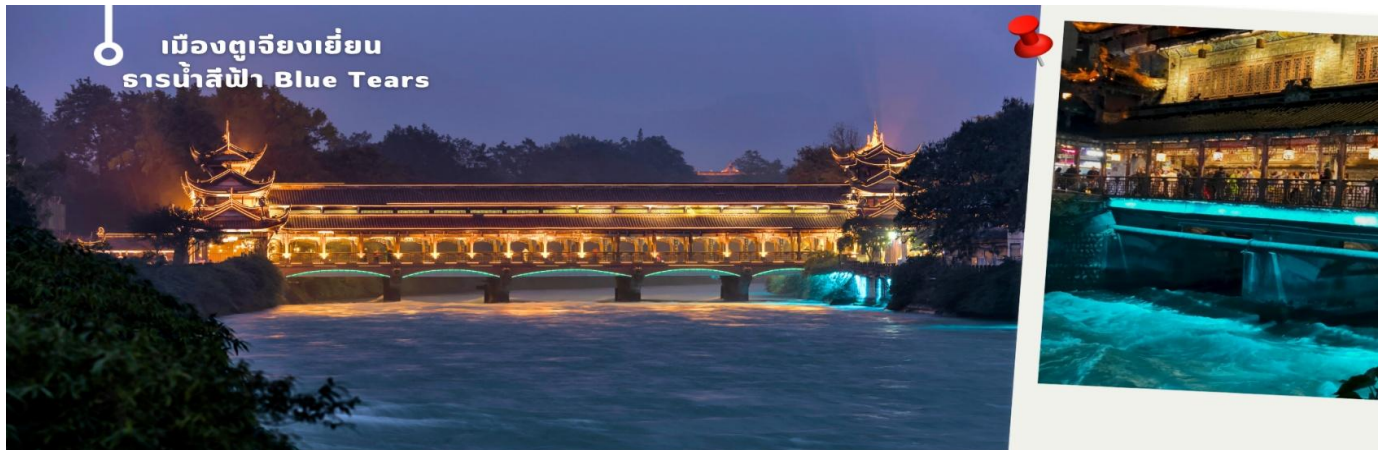
ค่ำ 📌 รับประทานค่ำ ณ ภัตตาคาร (6)

แต่ยังเป็นที่ยังคงในฐานะสถานที่ชมความงามของปรากฏการณ์ “น้ำตาสีฟ้า” ที่ตราตรึงใจนักท่องเที่ยวทั่วโลก ให้ท่านเข้าชม ธารน้ำสีฟ้า Blue Tears เป็นจุดท่องเที่ยวที่เต็มไปด้วยมนต์เสน่ห์แห่งสถาปัตยกรรมจีนแบบดั้งเดิม ทอดยาวข้ามแม่น้ำ กลายเป็นภาพอันน่าประทับใจยามค่ำคืนเมื่อแสงไฟตกแต่งส่องสะท้อนน้ำให้กลายเป็นสีฟ้าเงิน ดูสวยงามราวกับโลกแห่งจินตนาการ ความพิเศษอยู่ที่การจัดไฟอย่างประณีต ซึ่งช่วยเน้นให้สะพานมีชีวิตชีวาท่ามกลางบรรยากาศยามค่ำคืนที่รายรอบไปด้วยภูเขาและต้นไม้เพิ่มความรู้สึกสงบและสดชื่น เมื่อเดินข้ามสะพานนี้แล้วได้สัมผัสกับบรรยากาศรอบๆ มีแสงไฟที่ส่องประกายลงสู่ผืนน้ำจึงเป็นประสบการณ์ที่ทำให้รู้สึกผ่อนคลายและเต็มไปด้วยความประทับใจที่ยากจะลืม