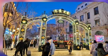
ถนนจงหยาง