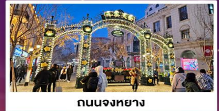
ถนนจงหยาง