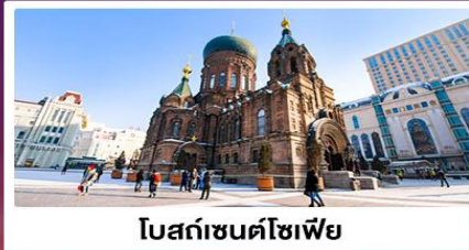
โบสถ์ซันต์โซเฟีย