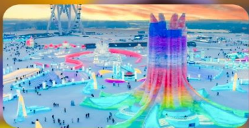
เทศกาลแกะสลักหิมะ