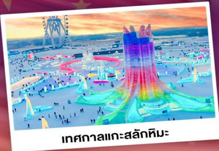
เทศกาลแกะสลักหิมะ