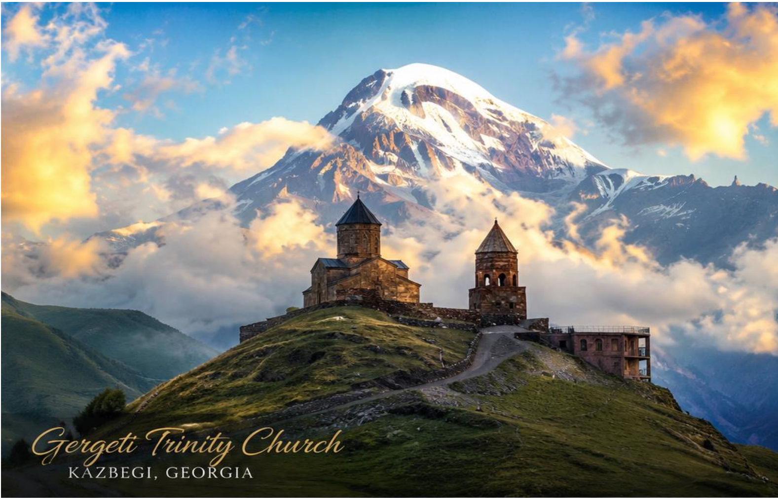
Gergeti Trinity Church KAZBEGI, GEORGIA