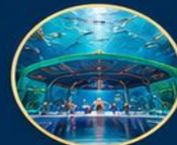
โลกใต้ท้องทะเล The Sea Shell