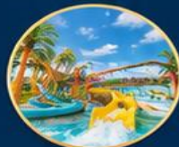
สวนน้ำไต้ฝุ่น Typhoon World