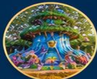
โลกแฟนตาซี Fantasy World