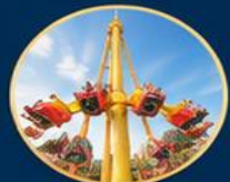
โลกการผจญภัย Adventure World