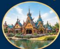
หมู่บ้านไวคิง Mysterious Viking Village