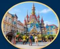
ถนนยุโรป European Streetmosphere