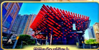
พิพิธภัณฑ์ศิลปะ