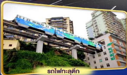
รถไฟฟ้า-ลูตัก