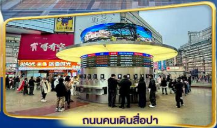
ถนนคนเดินสี่ป่า